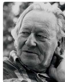
Watzlawick, Fisch und Weakland bei Fallbesprechungen am MRI, das Mental Research Institute in Palo Alto, Don D. Jackson und Gregory Bateson.

nach Rom; doch über Nacht verstirbt ihm seine Einkommensquelle. Durch Zufall kommt er daraufhin an die Food and Agriculture Organisation (FAO) der UNO, wo er schließlich deutlich mehr verdient, als er es bei seiner ursprünglichen Anstellung getan hätte.